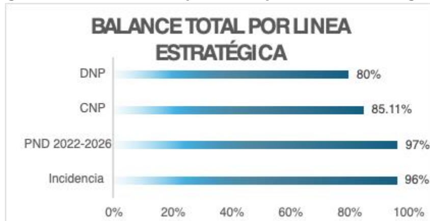
Figura 2. Gráfico de Cumplimiento por Líneas Estratégicas